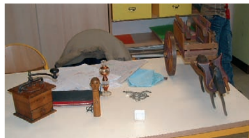
Les premiers objets anciens rassemblés par les enfants de l'école Jean Moulin

Un message aux autres porteurs de projets : si vous avez des poèmes qui évoquent les grands-parents nous sommes preneurs, nous les dirons à notre manière. Et en mai, nous aimerions partager un moment avec une autre classe.