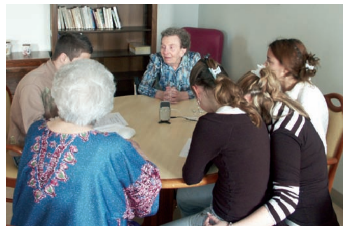
Les lycéens écoutent avec intérêt le récit des personnes âgées