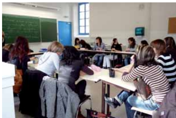
Des élèves concernées par l'avenir du monde.

Les élèves du lycée des Gorges (Voiron) démarrent tout juste leur projet. Ils vont créer une œuvre plastique représentant leurs idées sur l'avenir du monde. Nous les avons rencontrés lors d'une séance de réflexion et de partage de points de vue.